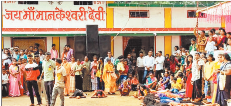
5 अक्टूबर को निशा पूजा पूरे विधि-विधान के साथ की गई। जब वह पूजा होती है तो राज प्रसाद से एक ढीली अंगूठी बैगा के अंगूठे में पहनाई जाती है। हालांकि ये अंगूठी बैगा के नाप की नहीं होती, लेकिन बलि पूजा के दौरान बैगा के अंगूठे में वो अंगूठी पूरी तरह से कस जाती है। इससे एहसास होता है कि अब देवी का वास बैगा के शरीर में हो गया है। उसके बाद श्रद्धालु बैगा के पैर धोते हैं और सिर पर दूध डालकर पूजा करते हैं।